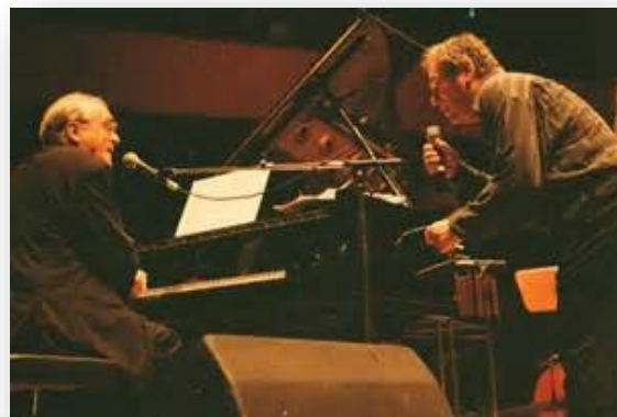
Michel Legrand et Claude Nougaro